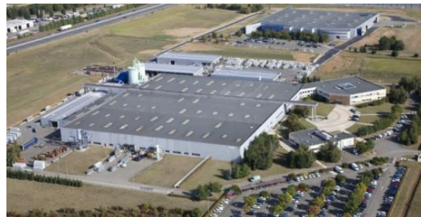
Siège social L'ATRIUM 1 Av Gustave Eiffel 28000 CHARTRES