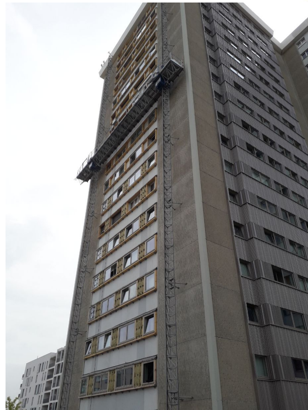
Résidence Quetigny I - Epinay Sur Seine